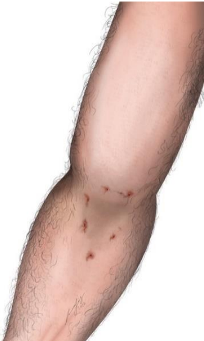
Abb. S8 Nadeleinstichstellen