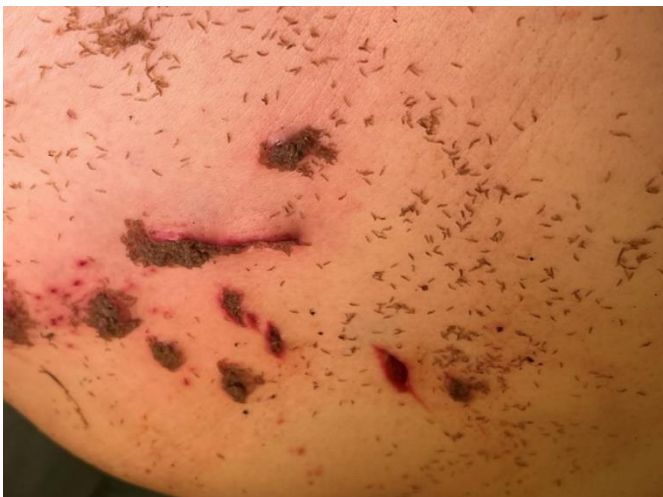
Abb.S11 Liegetrauma mit suizidalen Stichverletzungen und sekundärem Madenbefall