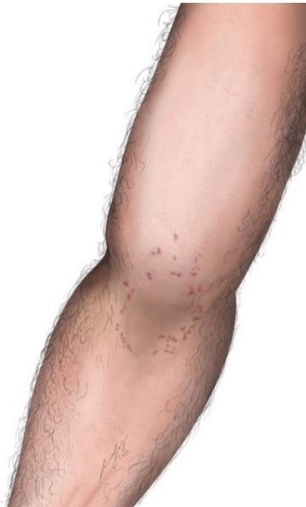
Abb. S2 Petechiale Einblutungen in der Ellbeuge