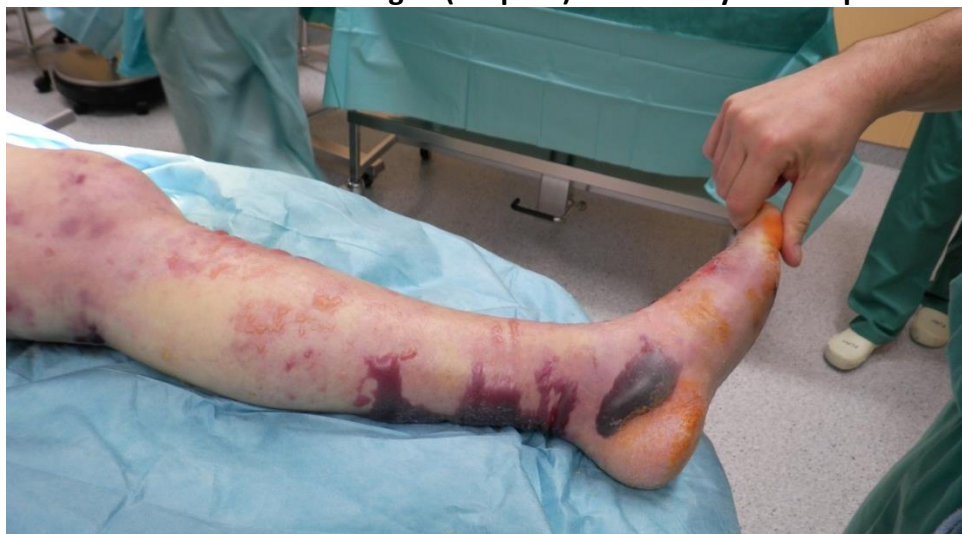
Abb. S4 Hauteinblutungen (Purpura) bei foudroyanter Sepsis