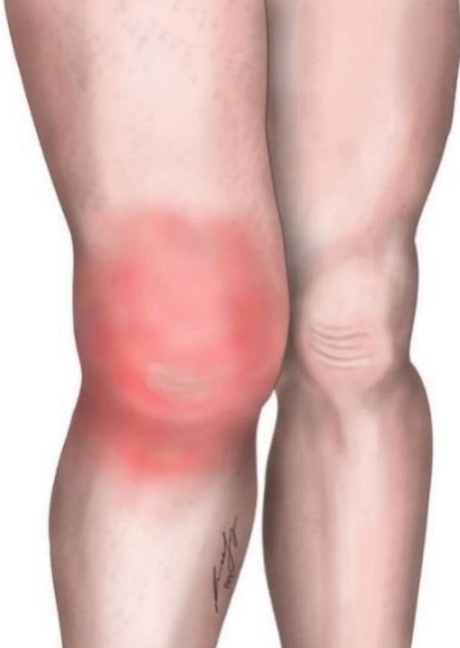
Abb. S1 Rötung (Erythem) am rechten Knie