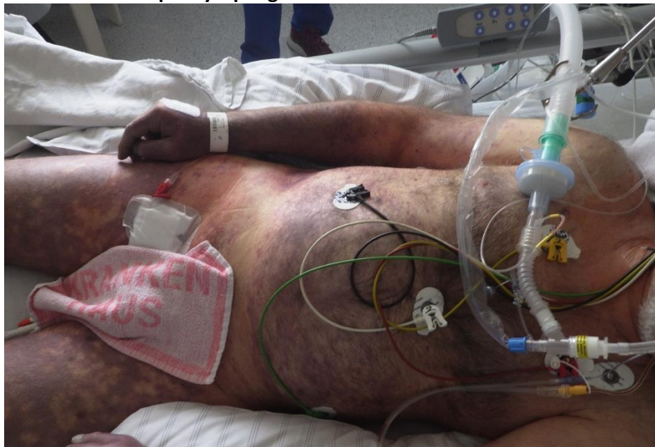
Abb.S3 Disseminierte intravasale Gerinnung bei Capnozytophagen-Infektion