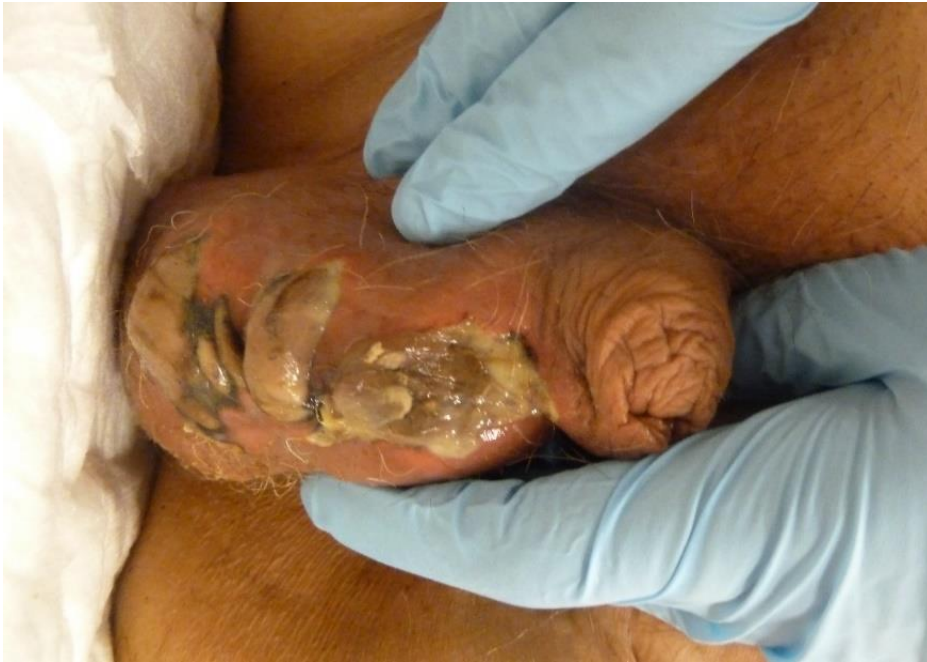
Abb. S5 nekrotisierende Infektion des äußeren Genitals (Fournier-Gangrän)