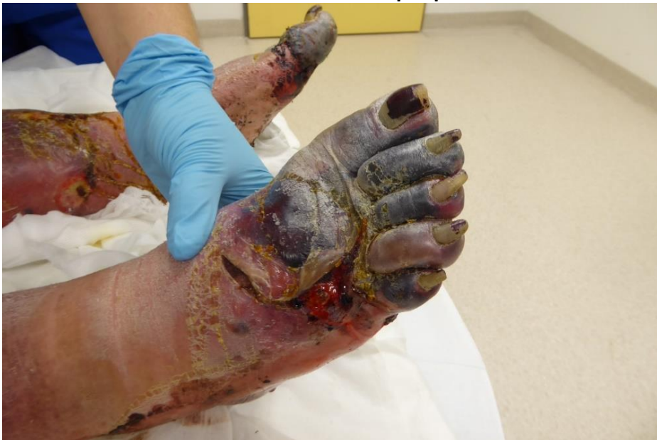
Abb. S6 Mazeration und Nekrosen bei peripherer arterielle Verschlusskrankheit