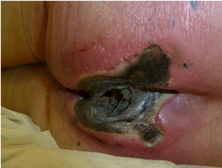
Abb. S9 Nekrotisierender Dekubitus bei Pflegebedürftigkeit