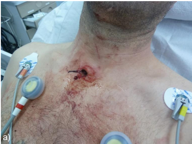
Abb. S10a+b Kontakt mit Starkstrom – Strommarken Eintritt (a), Austritt (b)